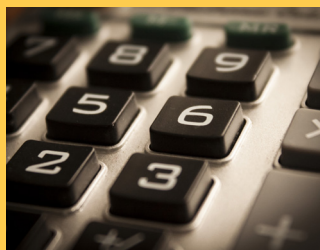
Formation en 2 ans

Le technicien supérieur en Comptabilité Gestion est amené à exercer une activité de comptable, soit dans une petite structure en tant que comptable unique, soit comme comptable spécialisé intégré à une équipe, dans une structure de plus grande dimension.