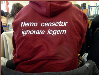
Formation en 2 ans