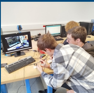
Formation en 2 ans